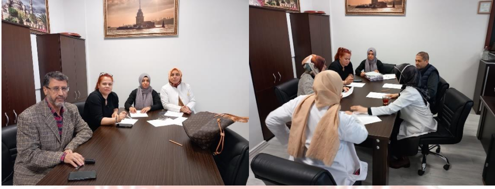
Hedef YKS 2024 Projesi Akademik Takip Kurul Toplantısı