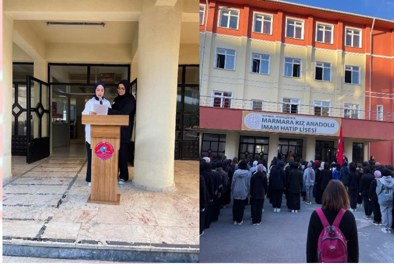
10 Kasım Anma Töreni