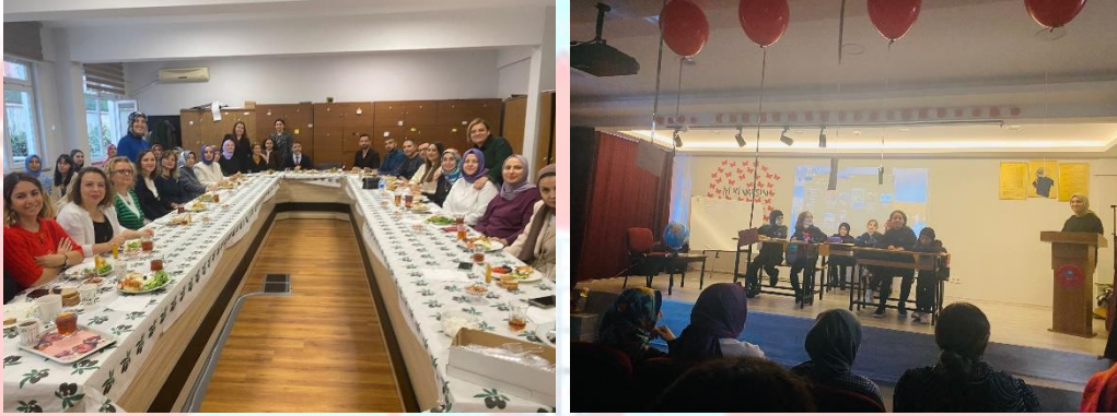
24 Kasım Öğretmenler Günü Etkinliği