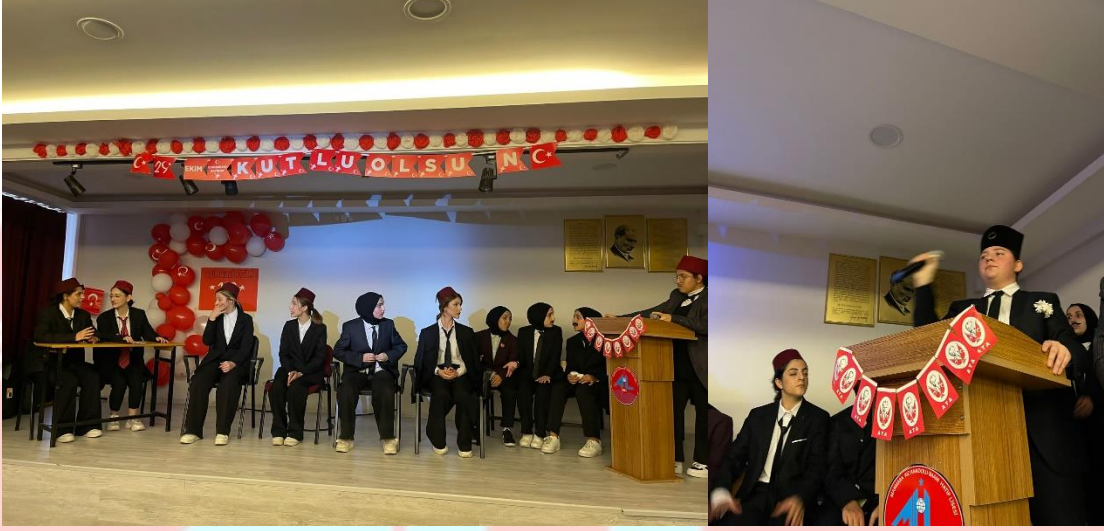
29 Ekim kutlamaları