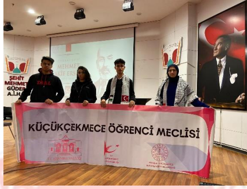
Öğrenci meclisi çalışmaları