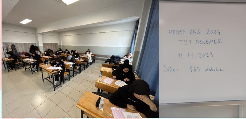
8, 11. ve 12. Sınıflar için Deneme Sınavları