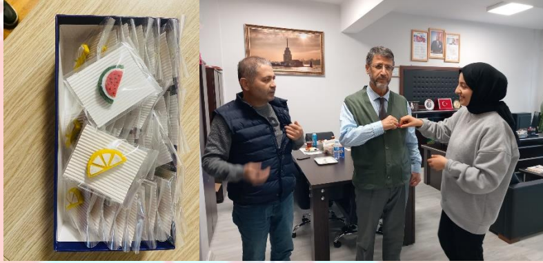
Filistin halkı için yardım ve farkındalık çalışmaları