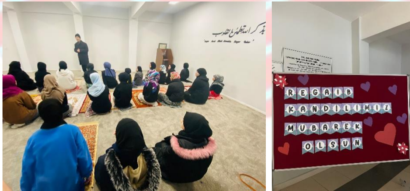
Üç aylar, hatim ve cemaatle namaz bilinci